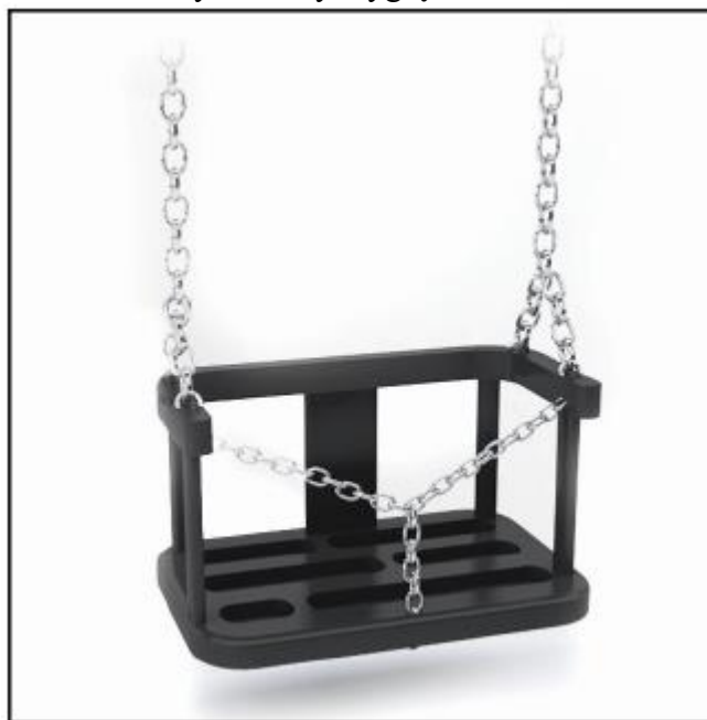
Przykładowy wygląd siedziska

□ Słupy drewniane, iglaste bezrdzeniowe, toczone cylindrycznie. Średnica 12 cm. Impregnowane, mocowane do podłoża za pomocą stalowych kotew, oczyszczanych w procesie piaskowania i malowanych proszkowo.