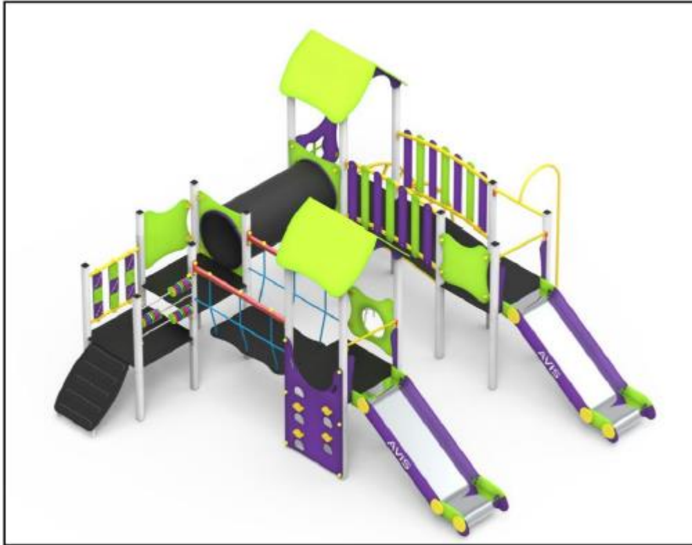
Przykładowy wygląd urządzenia zabawowego